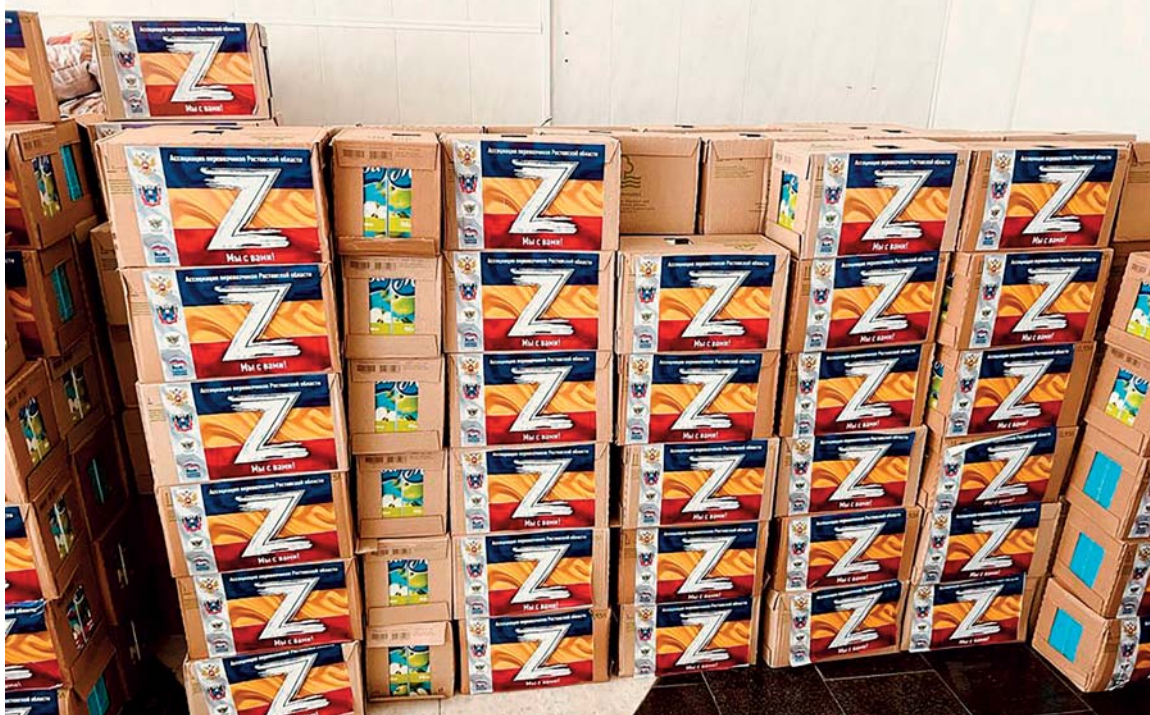
Гуманитарная помощь для участников СВО