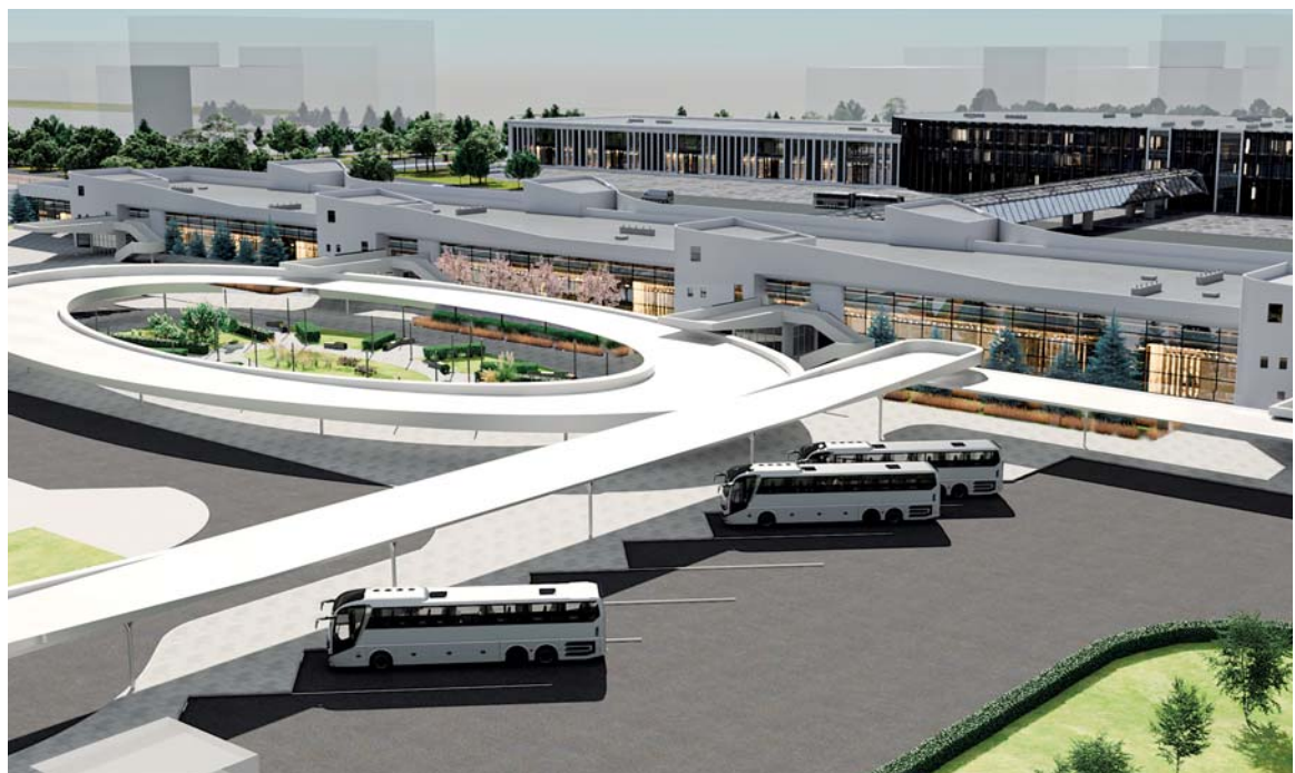
Компьютерные рисунки – рендеры будущего автовокзала

– Проект подразумевает две очереди строительства, – пояснила Алёна Беликова. – Первая очередь – это фасад вокзала, то есть северная сторона здания, вторая очередь – тыльная часть. С учетом всех площадей автовокзал в общей сложности сможет принимать от 12 до 15 тыс. пассажиров ежедневно. Площадь зоны свободного доступа составляет порядка 3,6 тыс. кв. м, а также примерно 2,7 тыс. кв. м транзитная зона и транспортно-пересадочный узел. Предусмотрено строительство 8 перронов прибытия и 20 – отправления. В итоге автовокзал сможет ежедневно принимать до 1850 автобусов, которые следуют по пригородным, между-