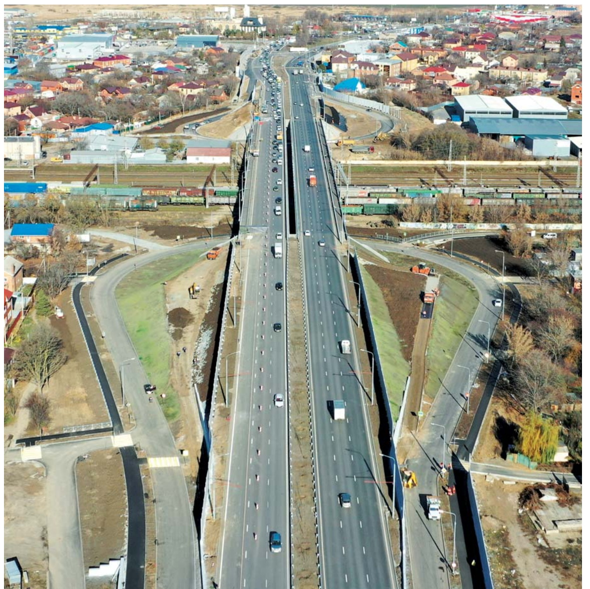
Путепровод по ул. Малиновского