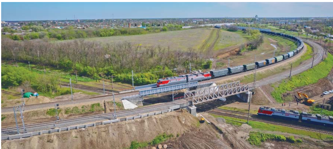
Модернизация ст. Тихорецкая

В рамках реконструкции выполнены работы по созданию и модернизации трех постов электрической централизации (отвечают за управление стрелками и светофорами), вводу в четырех парках новых устройств микропроцессорной централизации (управляет устройствами автоматики), а также по строительству нового железнодорожного путепровода длиной 34 м.