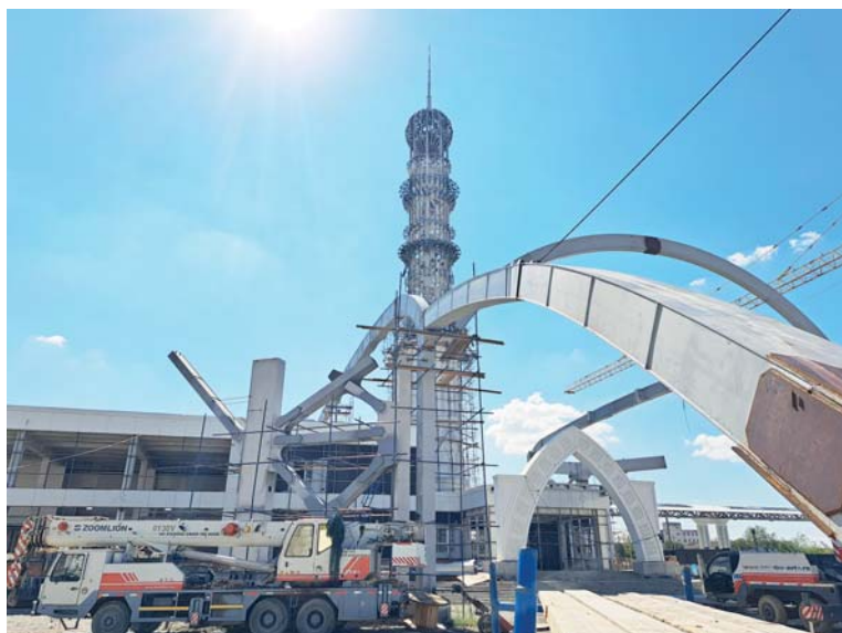
Строительство ж/д вокзала Грозный

Сегодня также имеются все возможности для удовлетворения растущего спроса на перевозки по Транскаспийскому маршруту МТК «Север – Юг». Грузоотправителям, в частности, предлагается организация доставки экспортных грузов по железной дороге в порт Махачкала для последующей отправки через Каспий.