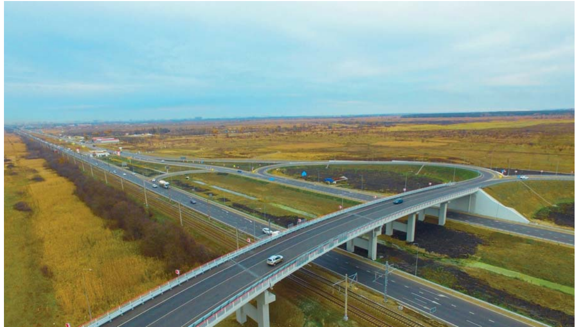
Транспортная развязка на автомобильной дороге Энем – Новобжегокай

– На данный момент в рамках национального проекта «Безопасные качественные дороги» нашей организацией выполняются работы по капитальному ремонту мостов