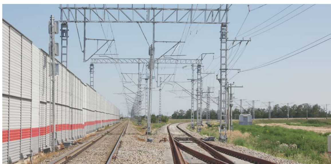
Строительство новой линии Аэропорт Анапа – Тамань–Пассажирская – Анапа