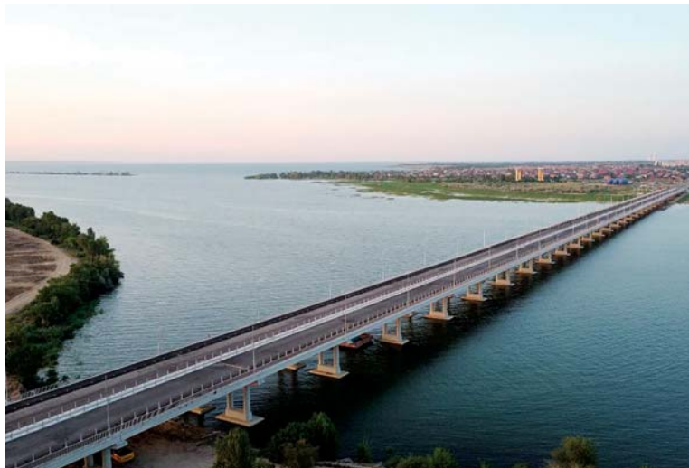
Мостовой переход через балку Сухо-Соленовская

– АО «Ростовавтомост» – динамичная, бурно развивающаяся компания, ставящая своим приоритетом благополучие сотрудников. Для этого ведется работа по наращиванию материально-технической базы предприятия и привлечению молодых специалистов.